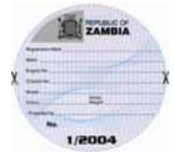
Vignette pour la Zambie