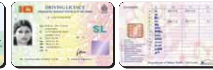
Permis de conduire du Sri Lanka