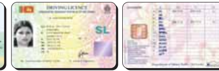
Permis de conduire du Sri Lanka