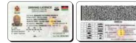
Permis de conduire du Malawi