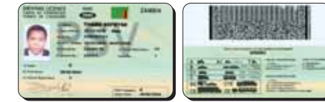
Permis de conduire de la Zambie