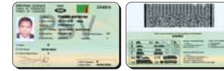
Permis de conduire de la Zambie