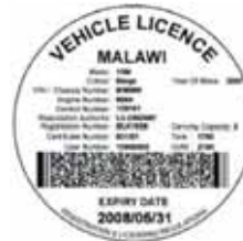
Vignette pour le Malawi